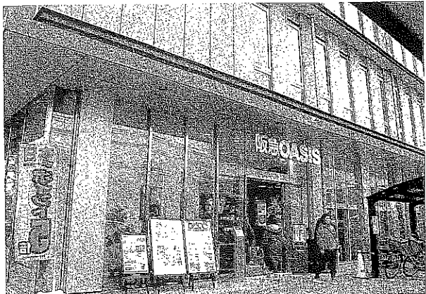
今年4日からの営業に変更した阪急オアシス（写真は西院店）

売市場では「正月商戦は、年々ヤマが小さくなる」とも、期間を短くする「1日」の声を毎年聞く。また、食育基本法が制定されて今年で10年。日本人の文化としての「正月の過ごし方」があらためて問われている。そこで、多々新聞大阪支社では、近畿圏で店舗展開するスーパー・生協10社を対象に、「正月三日が日」休業に関するアンケートを実施した。